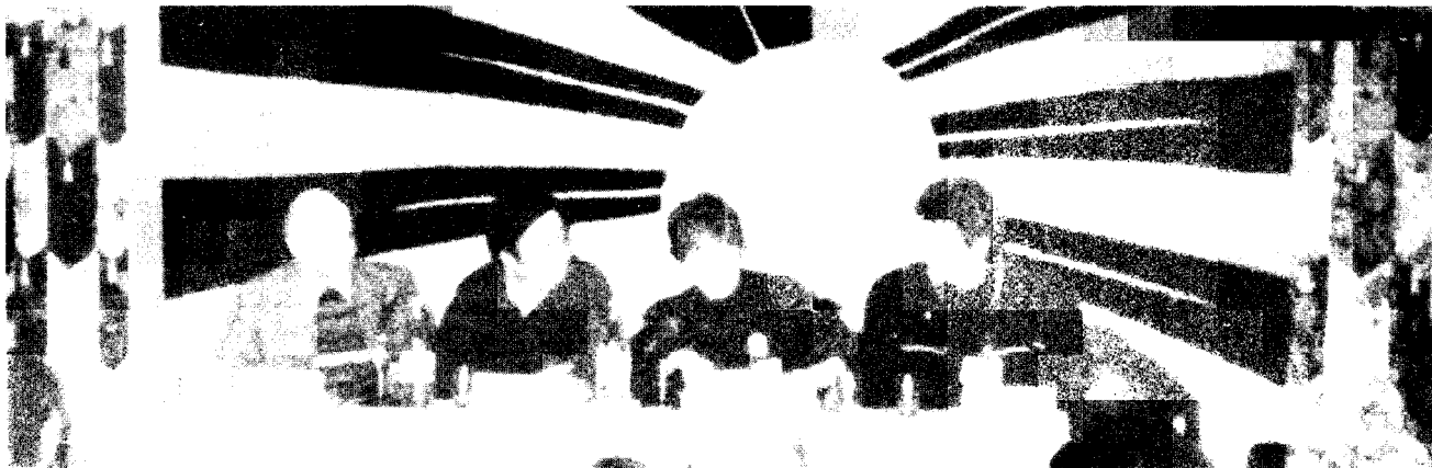
Letzte Konferenzsitzung unter der Leitung von Lodi Gyari Von links nach rechts: Gert Bastian, Kalon Lodi Gyari, Petra Kelly, Richard Gere

einem zukünftigen freien Tibet befürwortet er dabei eindeutig eine Demokratie, wie sie im Exil bereits praktiziert wird, und die zu dem großen Erfolg der tibetischen Flüchtlingsgemeinden geführt hat. Er selbst beabsichtigt, sich nach einer eventuellen Etablierung eines demokratischen Systems in Tibet aus den Regierungsgeschäften zurückzuziehen. Er berichtete von seinem 5-Punkte-Friedensplan und seinem Straßburger Vorschlag, in Verhandlungen mit China einzutreten, mit dem Entgegenkommen, auf außenpolitische Autonomie zu verzichten, wenn Tibet seine inneren Angelegenheiten selbst regeln kann. Er betonte jedoch, daß die letztliche Entscheidung darüber nicht bei den Exilanten liegen könne, sondern von der Mehrheit der Tibeter in Tibet getroffen werden müße . Nach seinen Worten ist es die Aufgabe der Tibeter , gegenwärtig klare Perspektiven für ein demokratisches Tibet zu entwerfen, internen Streit zu vermeiden und sich aktiv und in die Zukunft blickend für den Aufbau eines neuen Tibets zu engagieren.