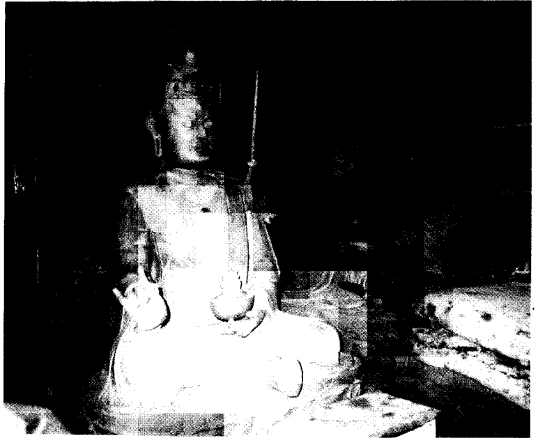
ehe unbemalte Tonstatue der Meisters Guru Padmasambhava im Kloster Ganden, Tibet

Die tantrischen Lehren und Übungen sind traditionell nur einer ganz besonders befähigten Schülerschar vorbehalten. Die Schüler müssen sehr aufrichtig, intelligent, entschlossen und sehr diszipliniert sein. Sie müssen, von unvorstellbarem Mitgefühl ge-