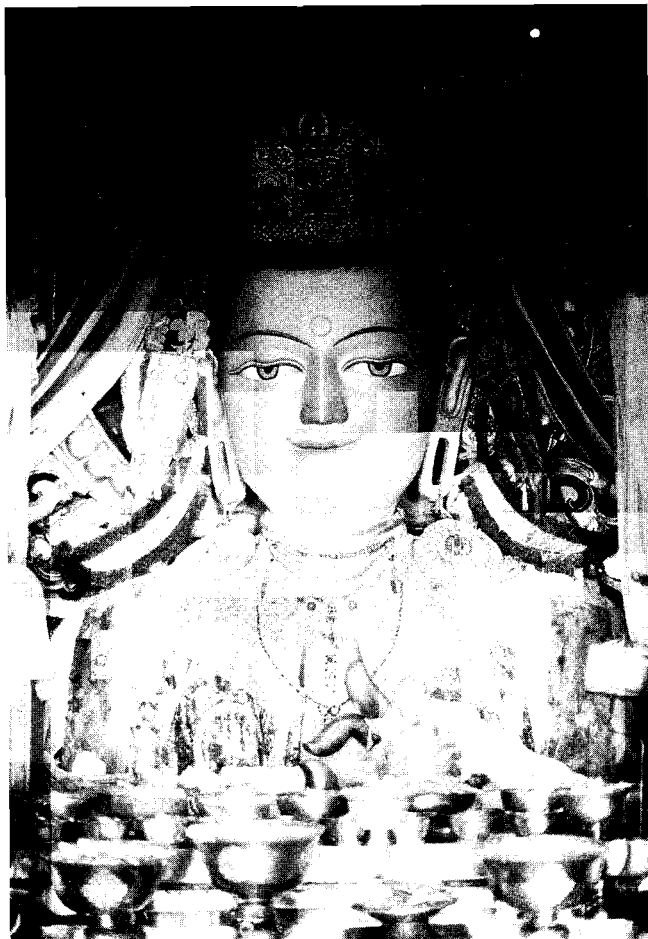
Eine große Maitreya-Statue in einer tibetischen Klosteruniversität

Diese sogenannten Gottheiten sind keine Gottheiten in dem uns bekannten Sinne. Es sind vielmehr bestimmte Erscheinungsformen oder Manifestationen , in denen Buddha Sākya-muni bestimmten Schülern und Meistern erschien, um ihnen - in einer