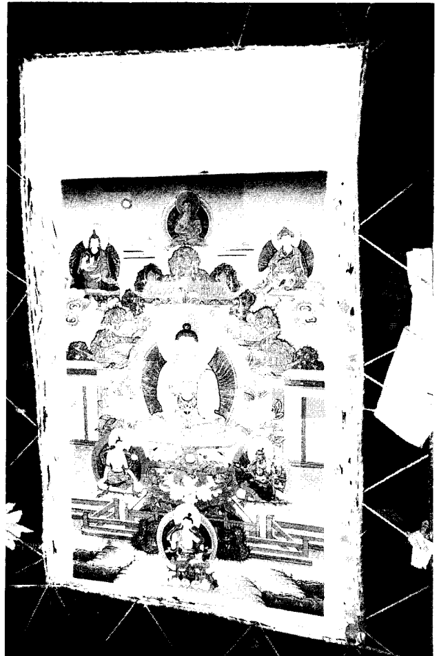
Ein noch unvollendetes Thangka von Buddha Amithaba

Vorbereitungen sind es – selbst die ganz praktischen wie das Spannen und Grundieren der Leinwand. Mit jedem einzelnen Schritt sollte eigentlich eine bestimmte Meditation einhergehen. So erklärt es sich auch, daß viele Künstler Mönche waren und daß die größten Malschulen sich innerhalb der Klöster befanden.