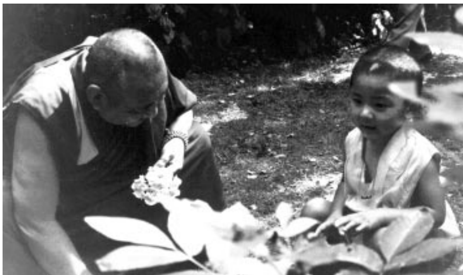
Geshe Rabten ist wieder da! Im Sommer 1991 weilte der Tulku Tenzin Rabgye, für dessen religiöse Erziehung Gonsar Rinpoche in der Schweiz sorgt, im Zentrum.

TiBu: Wenn Du Dich damals nicht bemüht hättest, Geshe Rinpoche nach Hamburg zu holen und das Zentrum zu gründen, wäre es sicherlich auch lange nicht dazu gekommen. Bist Du stolz, wenn Du auf das Erreichte zurückschaust?