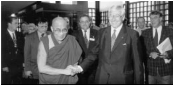
Der Vorsitzende des Unterausschusses für Menschenrechte, Christian Schwarz-Schilling, begrüßt den Dalai Lama vor der für die Tibeter wichtigen Sitzung.

nach Tibet etwas zu erreichen, was Repression und militärische Macht nicht vermocht hätten: die Identität des tibetischen Volkes zu zerstören und die Tibeter zu einer Minderheit im eigenen Land zu machen.