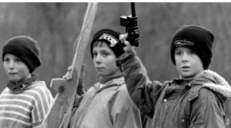
Der Gebrauch von Spielzeug-Waffen verringert die Schwelle zur Anwendung von Gewalt.

Es ist nicht ratsam, Kindern Spielzeug-Waffen in die Hand zu geben, weil daraus später eine reale Waffenliebe werden kann. Das liegt in der Natur des Geistes: Je mehr wir uns mit einer Sache beschäftigen, um so stärker wird die Gewohnheit - im Negativen wie im Positiven. Aus einer gemalten Waffe wird spä-