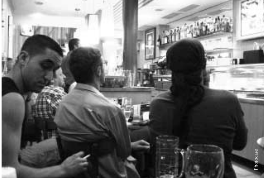
Medien haben eine starke Anziehungskraft und hindern junge Menschen daran, nach innen zu schauen.

Vielleicht müssen wir den Bildungsbegriff überdenken oder neue Formen der Erziehung finden, die über das bloße Wissen hinausgehen und die Potenziale des Menschen vervollkommen. Dafür ist es notwendig, dass alle relevanten Kräfte in der