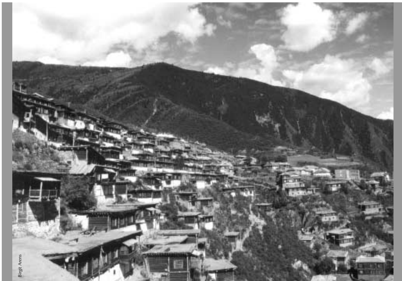
Das Kloster Palyul in Osttibet gehört zu den sechs wichtigsten spirituellen Zentren der Nyingma-Tradition.

Wir starten eine neue Serie über die vier buddhistischen Traditionen Tibets. Kenntnisse über andere Übungswege dienen dem besseren Verständnis und fördern die Harmonie unter den verschiedenen Traditionen. Teil 1 beschäftigt sich mit der ältesten buddhistischen Tradition Tibets: der Schule der Nyingmas.