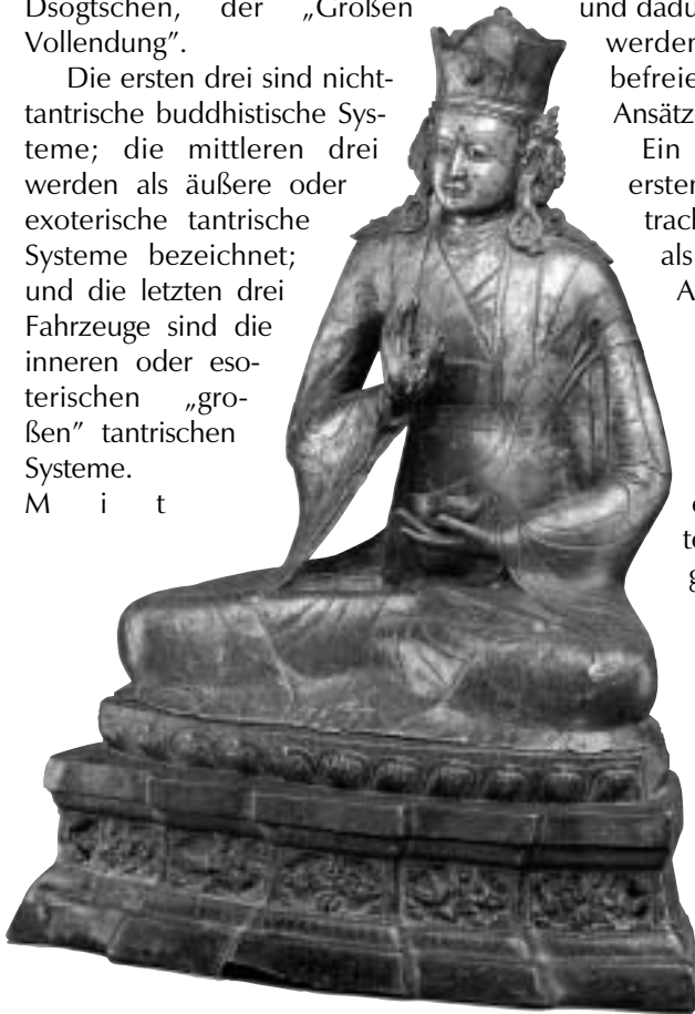
Padmasambhava gilt als bedeutendster Meister der Nyingma-Tradition.

Ausnahme der ersten beiden gehören alle Fahrzeuge zum Mahāyāna. Jedes dieser Fahrzeuge wird zuweilen auch nach Begriffen wie Zugangsmittel, philosophische Ansicht, Meditationspraktiken, Verhaltenskodex und Resultat definiert.