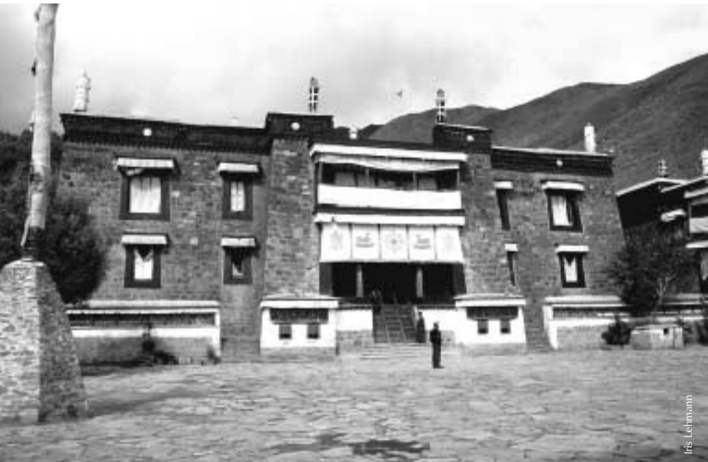
Das Kloster Mindroling in Zentraltibet, 1656 gegründet, ist heute noch ein wichtiges spirituelles Zentrum der Nyingma-Tradition.

Jh.), der Ära der großen monastischen Zentren, erlebte die Nyingma-Schule einen neuen Aufschwung. Jahrhundertlang existierten die Nyingma-Zentren nur vereinzelt und führten eine bescheidene Existenz. Einer der Gründe dafür könnte im mangelnden Interesse der Nyingmapas an Politik und Macht liegen. Nun jedoch wurden bedeutende neue Klöster gegründet: die sogenannten „Sechs Großen Hauptsitze“ – Dorje Drak (um 1610) und Mindroling (1656) in Zentraltibet, Zhechen (um 1734), Dsogtschen (um 1685), Kathok (wiederbelebt um 1656) und Palyul (1665) in Osttibet – gehen auf diese Zeit zurück. Jedes von ihnen hat mehrere Zweigklöster. Die Gründer, die nachfolgenden Linienhalter, die Thronhalter und die Äbte dieser Klöster haben ihre jeweiligen Traditionen bis auf den heutigen Tag weitergegeben und bewahrt.