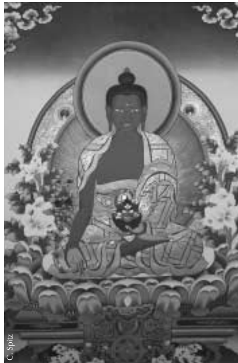
Die Praxis des Medizin-Buddha kann Heilung unterstützen.

Die Kraft entsteht also zum einen aufgrund der Wunschgebete und des großen Mitgefühls des Medizinbuddhas und auch aufgrund der Praxis des Vertrauens auf der Seite des Übenden.